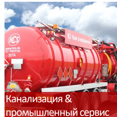
Канализация & промышленный сервис