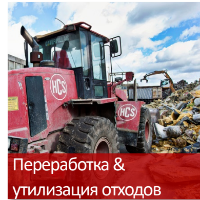
Переработка & утилизация отходов