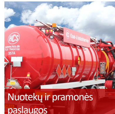
Nuotekų ir pramonės paslaugos